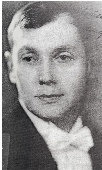
Jewhen Małaniuk (1897-1968) w 50. rocznicę śmierci

12.00-13.30 przerwa obiadowa // обідня перерва