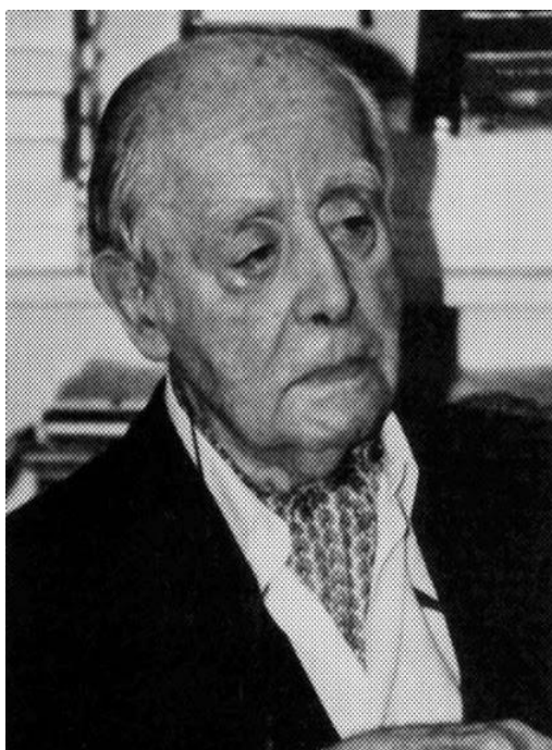
Jerzy Giedroyć (1906-2000) w 20. rocznicę śmierci

szesnasta z cyklu dorocznych sesji prometejskich